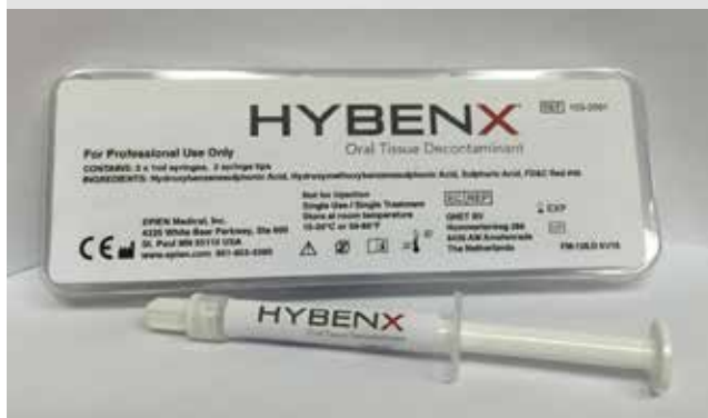
Blister (2 siringhe liquido) 1 ml di prodotto ciascuna