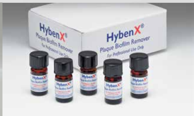
Fiale da 2 ml di prodotto (2 flaconi)

Ideale per il trattamento di perimplantiti e tasche parodontali