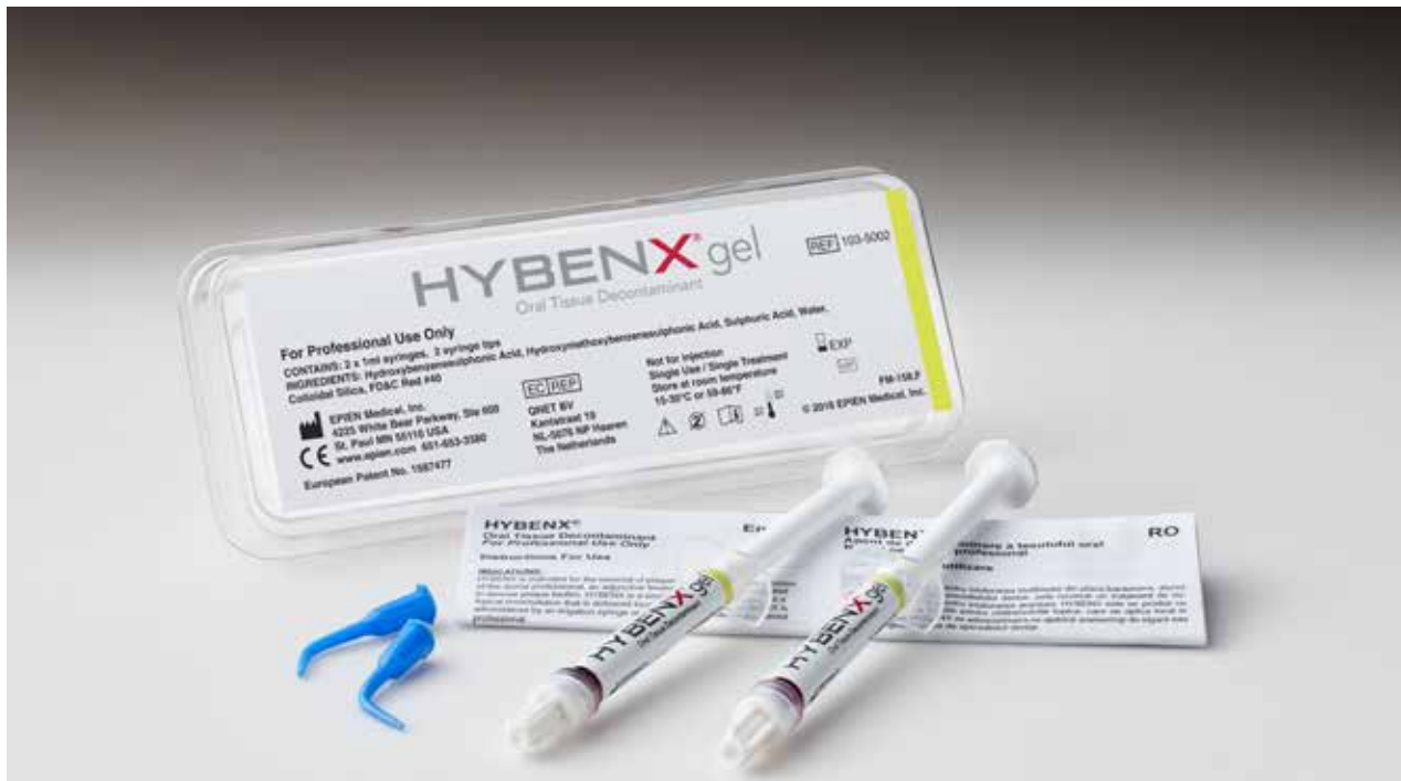
Blister (2 siringhe gel) 1 ml di prodotto ciascuna